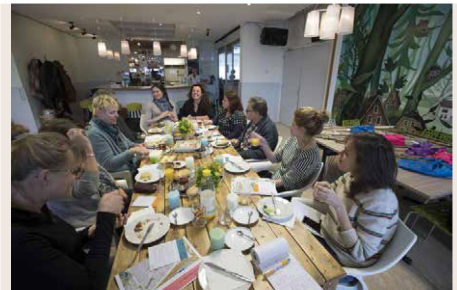
▲ Voor de deelnemers aan de Verhalenexpeditie lagen de knapzakken klaar voor hun tocht door de wijk.