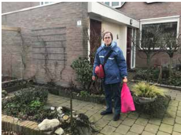
PROEFTUIN ACHTSE BARRIER

Deze dame heeft zichzelf ook opgegeven voor deze verhalenexpeditie. Ze is een actieve buurtbewoonster, ze is bezig een bloementuin te realiseren op een stuk braakliggend terrein in de wijk en zorgt ervoor dat haar eigen straat schoon blijft met het project 'adopteer een straat'. Ze heeft behoefte aan meer sociaal contact in de wijk voor bijvoorbeeld een gezamenlijke wandeling of fiets-ronde. Op zoek naar verbinding met andere bewoners in de wijk.